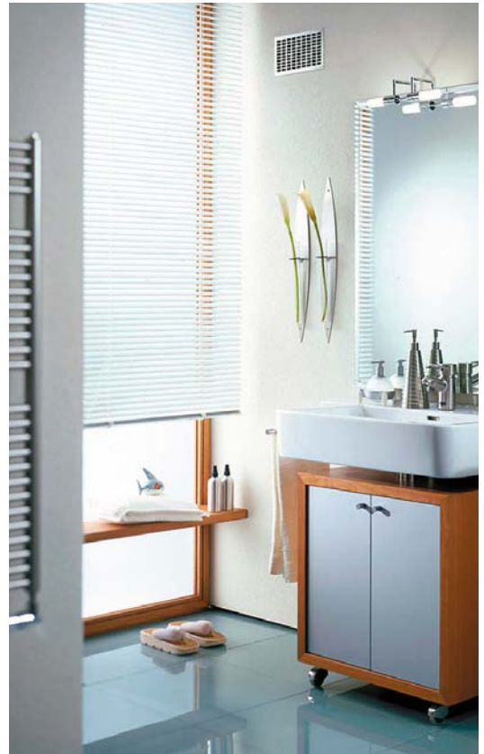
Komfortlüftungen versorgen den Innenraum bei geschlossenen Fenstern automatisch mit frischer Luft und führen Gerüche und Feuchtigkeit kontinuierlich ab.

Ob der Strom für Heizung und Haushalt des Minergie-Hauses mit Solarzellen auf dem Dach eben dieses Hauses oder auf dafür günstigeren grösseren Dächern oder sogar an Bergabhängen über der Nebelgrenze liegen, wo sie im Winter wesentlich mehr Strom erzeugen, ist eine Frage der wirtschaftlichen und ästhetischen Optimierung. Nachdem eine Dachwohnung von 150 m 2 einen Mietertrag von etwa 25000 Fr./a generiert, die geneigte Dachfläche darüber aber Strom im Wert von nur etwa